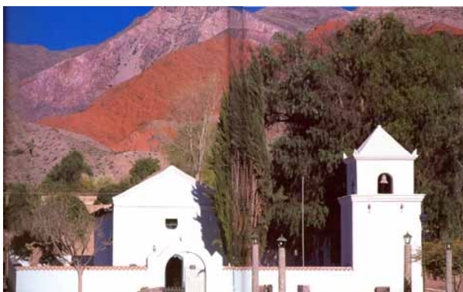
IMAGE 4. Église d'Uquía.