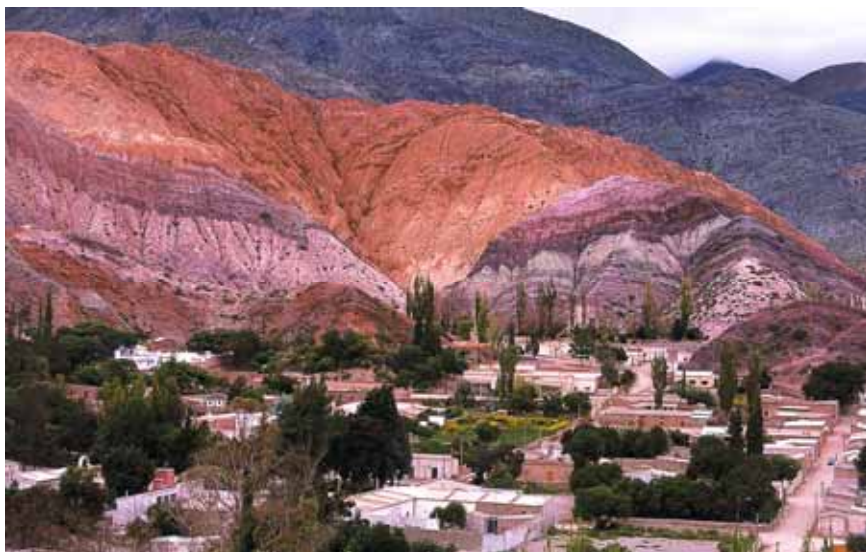
IMAGE 6. Pucara del Perchel et Pucara de Tilcara.