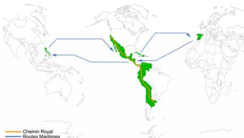
IMAGE 3. Chemin Royal Intercontinental.