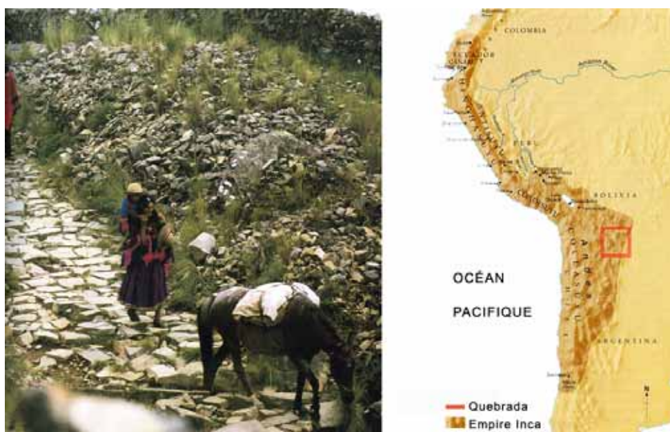
IMAGE 2. Qhapaq ñan où Chemin principal andin dans la vallée du Río Grande