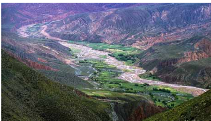
IMAGE 5. Cadre naturel. Vallée du Río Grande.