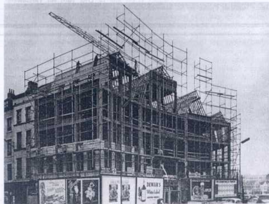
Fig. 2 - Bruxelles. Exemple d'architecture imposée à l'architecte. Immeubles « anciens » en construction au bar du Mont des Arts. Ossature en béton, parement de pierre blanche.