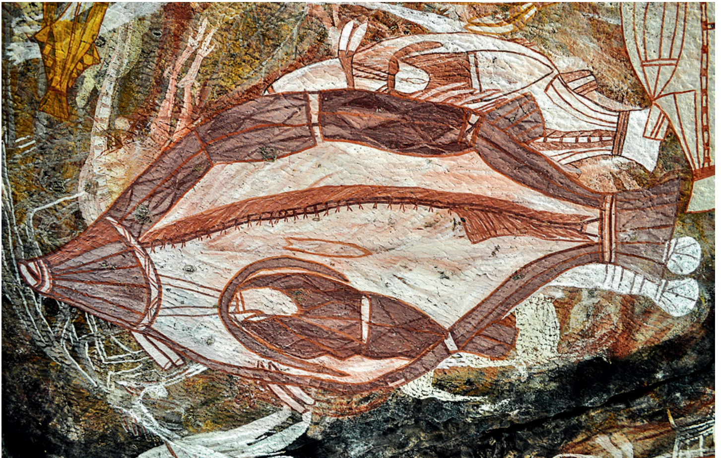
Fig. 1. a. Nawarla Gabarnmang showing extensively painted roof. Note the staggered ceiling levels indicating sheet-collapse layers of rock strata from the ceiling. Some of these collapsed layers of rock now lie horizontally buried below ground; others were removed to the site's northern and southern talus slopes by people in the past. b. Detail of the painted ceiling.