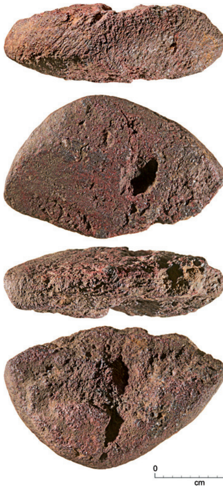
Fig. 6. Crayon d'ocre de Nawarla Gabarnmang, Carré A XU26, avec facettes et stries d'usure. Il est encadré par des dates radiocarbone de 12\,746 \pm 43 BP (Wk-28620) et 17\,833 \pm 77 BP (Wk-30468) et il apporte la preuve de l'exécution d'un art pléistocène dans la période 15 029-21 857 cal BP.

centimètres de sédiment (fig. 4). Les surfaces actuelles de la voûte juste au-dessus de ces niveaux de roches tabulaires portent de nombreuses peintures (fig. 5). L'une des priorités de notre recherche de terrain future est de fouiller certaines de ces grandes roches pour voir si elles sont décorées à la base. En outre, dans un certain nombre des carrés fouillés, nous avons mis au jour des crayons en ocre pléistocènes utilisés, porteurs de facettes et de stries d'usure (fig. 6). Nous publierons ces résultats le moment venu.