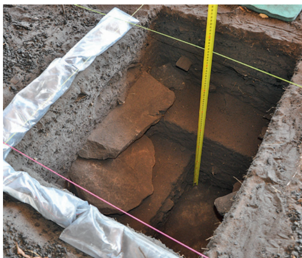
Fig. 3. Nawarla Gabarnmang, fouille en cours des carrés E et J montrant la présence de grandes dalles horizontales enterrées tombées du plafond. Elles ont scellé des niveaux sédimentaires sous-jacents et limité les déplacements postérieurs de matériaux.