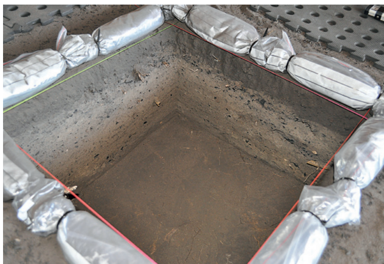
Fig. 4. Nawarla Gabarnmang, Carré P, parois sud et ouest après fouille. La base du carré est occupée par une roche plate horizontale. Ce n'est pas la bedrock mais la surface supérieure d'une partie effondrée de la voûte.