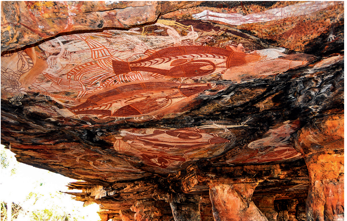
Fig. 1. a. Abri de Nawarla Gabarnmang au plafond abondamment décoré. Notez les niveaux distincts de la voûte témoignant de décrochages horizontaux de la roche. Certains se trouvent enterrés à l'horizontale sous le sol ; d'autres ont été déplacés dans le passé, par les gens, sur les talus au sud et au nord. b. Détail du plafond peint.