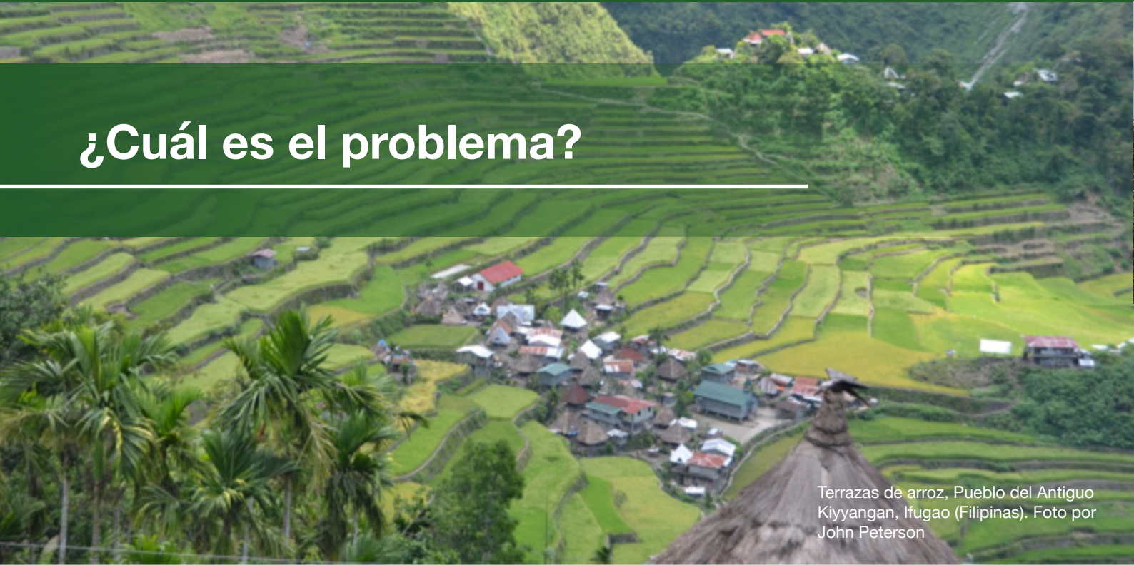
Terrazas de arroz, Pueblo del Antiguo Kiyangan, Ifugao (Filipinas).

E l tema de la justicia climática y la equidad reúne una gama de temas relacionados con los derechos humanos y culturales. Específicamente, se refiere a la distribución injusta o no equitativa de los impactos y las respuestas al cambio climático . Estos suelen afectar a los pobres y vulnerables que están experimentando una mayor desventaja social y económica y una erosión y marginación de sus derechos humanos y culturales individuales y colectivos. Estas experiencias pueden verse exacerbadas por la opresión, la discriminación, el racismo, el sexismo, la homofobia y la xenofobia. La promoción de la equidad implica reconocer cómo operan estas desigualdades en la práctica y trabajar para abordarlas. Más específicamente, requiere que reconozcamos que: