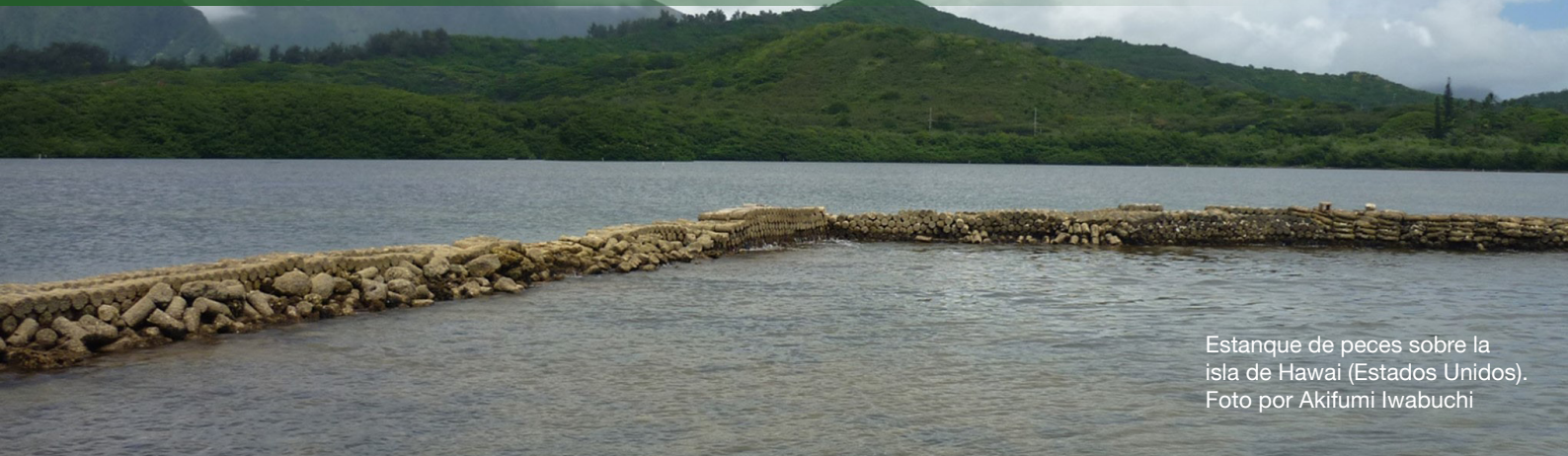
Estanque de peces sobre la isla de Hawái (Estados Unidos).

L a atención a la justicia climática y la equidad puede incluir acciones tanto individuales como colectivas. Estos pueden incluir: