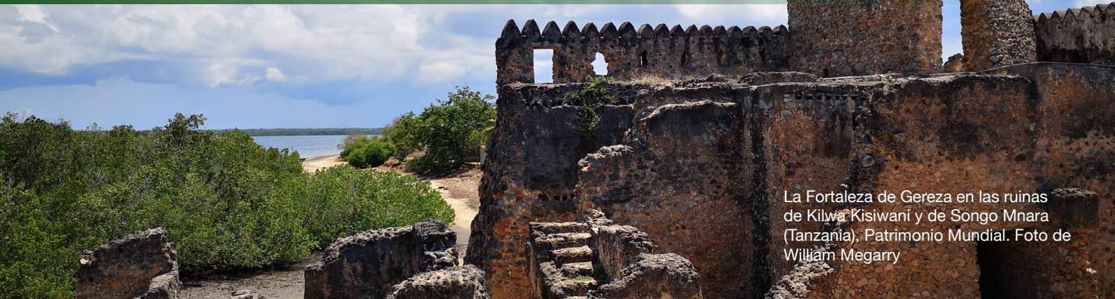
La Fortaleza de Gereza en las ruinas de Kilwa Kisiwani y de Songo Mnara (Tanzania), Patrimonio Mundial.

E l compromiso con la justicia climática es importante, ya que se trata de proteger y salvaguardar los derechos humanos y culturales de las personas y las comunidades. Como miembros de ICOMOS comprometidos con la salvaguardia del patrimonio, tenemos la responsabilidad de garantizar que la forma en que operamos sea justa y equitativa . Deberíamos y debemos demostrar sensibilidad y compromiso con la protección de los derechos humanos en todas nuestras actividades al establecer vínculos entre los derechos de las personas y un enfoque de desarrollo centrado en el ser humano que apunte a la protección de los derechos básicos de los grupos más vulnerables y al intercambio de los derechos Cargas y beneficios del cambio climático. Como parte de esto, deberíamos y debemos habilitar activamente a las comunidades para que estén a cargo de definir, implementar y contribuir como un socio igualitario a las acciones climáticas que protegen sus propios intereses, medios de vida, economías, patrimonio cultural y derechos.