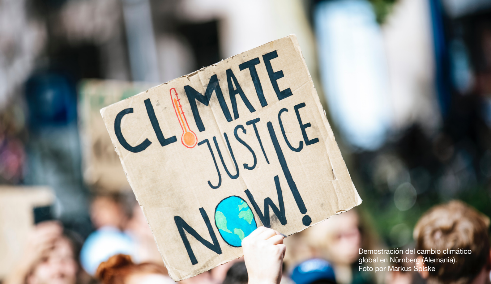
Demostración del cambio climático global en Nürnberg (Alemania).