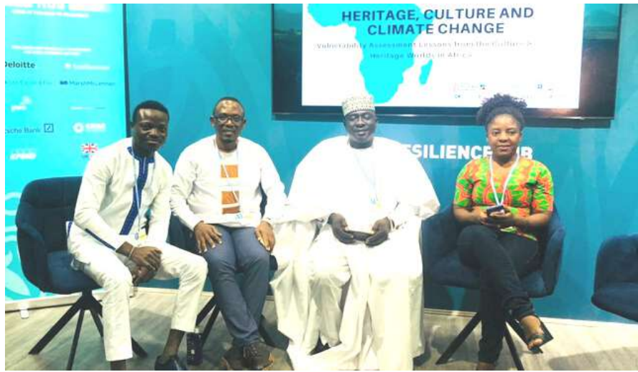
Photos des panélistes Heritage, Culture & Climate Change