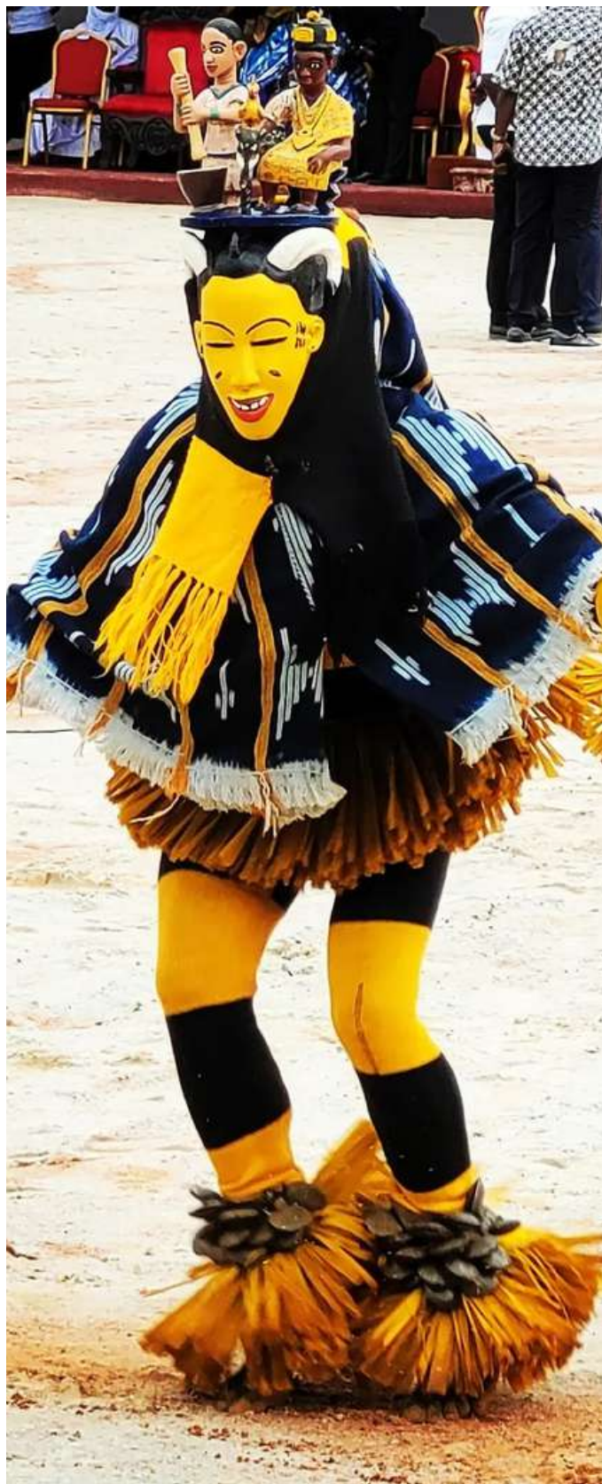
Danse - Masque Zoouli (Côte d'Ivoire)