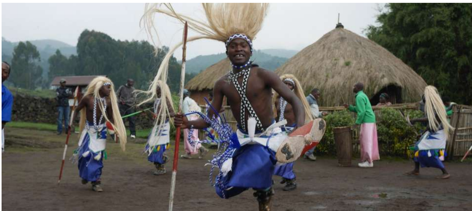
Un danseur traditionnel rwandais

Du 25 novembre au 03 décembre 2022, s'est déroulée à Rabat dans le Royaume du Maroc, la dix-septième session du Comité intergouvernemental de sauvegarde du patrimoine culturel immatériel. Au menu des points inscrits à son ordre du jour, le Comité composé de 24 Etats membres, a procédé entre autres, à l'examen des demandes d'inscription sur les différentes listes du patrimoine culturel immatériel. Près de quarante-sept éléments du PCI ont reçu l'avis favorable du Comité pour être inscrits sur les listes internationales du PCI, dont 5 en Afrique: