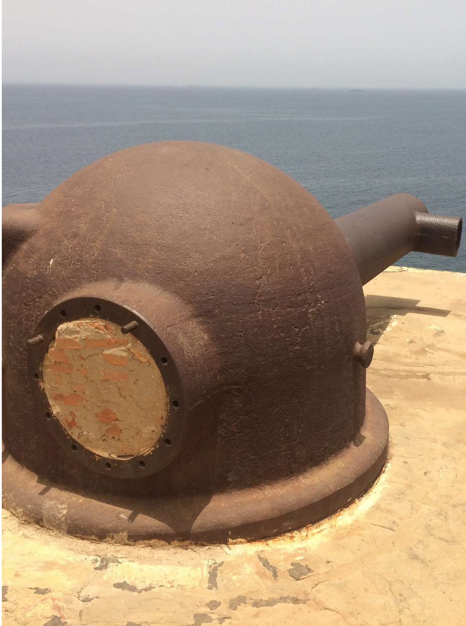
Canon d'artillerie. Fort de Cape Coast. Ghana © Aurelle. 2021