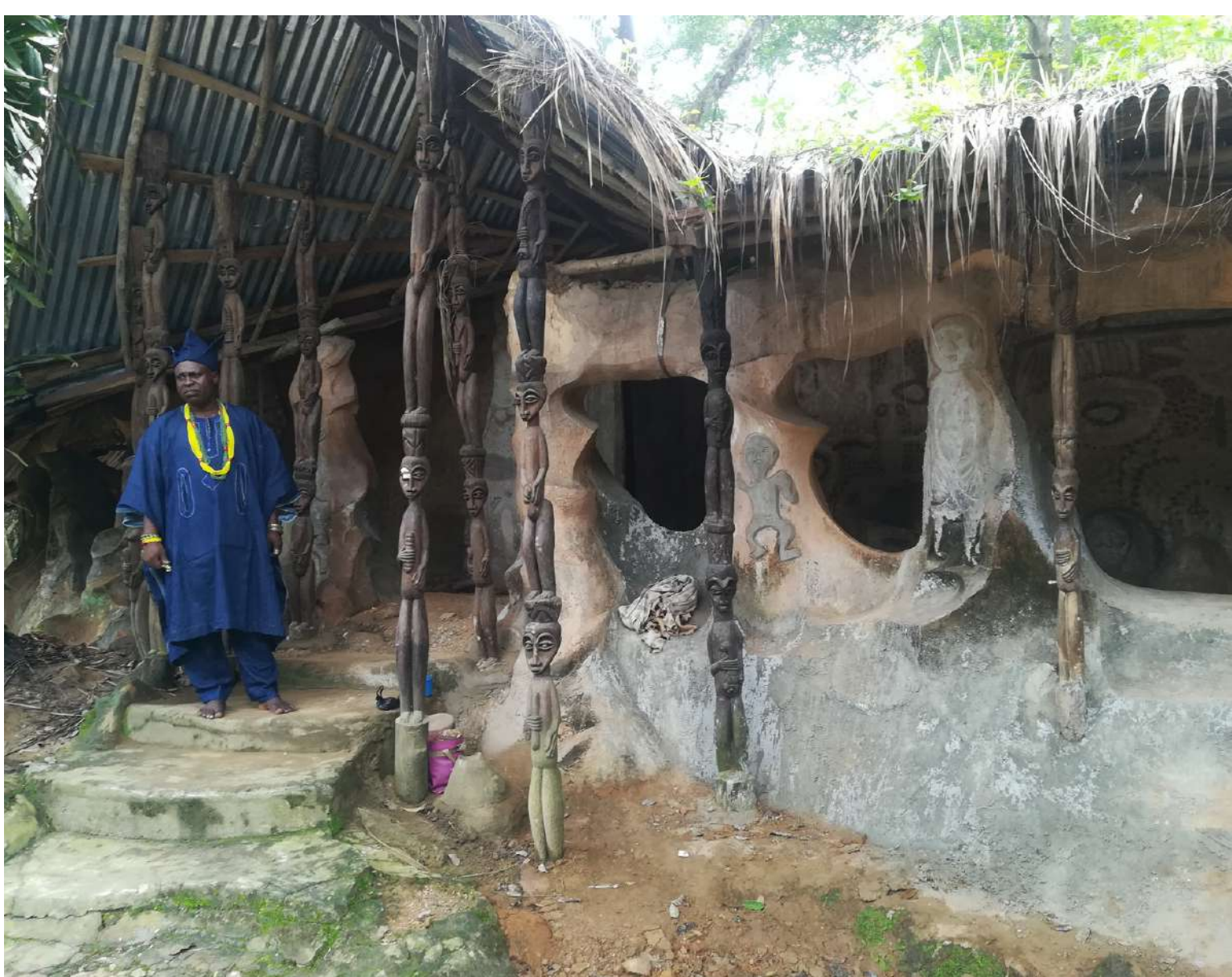
Forêt sacrée d'Osun-Oshogbo, Nigeria