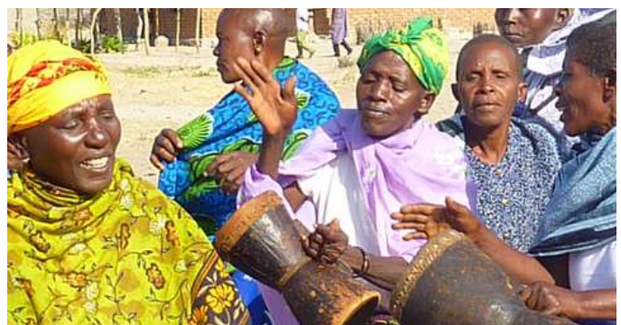
Chanteuses communautaires