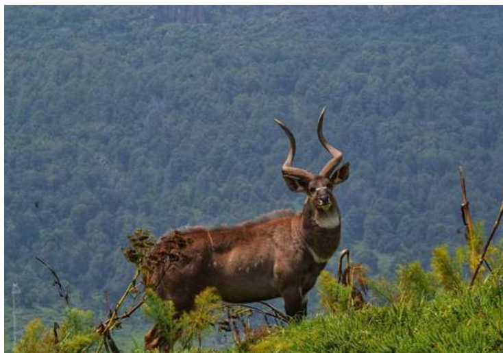
Parc National du Mont Bale

Le parc national des monts Balé (PNMB) est l'une des zones protégées d'Éthiopie. Il couvre environ 2 200 km 2 et est situé à 400 km au sud-est d'Addis-Abeba. Il figure sur la liste indicative des sites du patrimoine mondial depuis 2008. Ce parc étonnant abrite une flore et une faune endémiques (il comprend environ 26 % des espèces endémiques éthiopiennes) et couvre le plus grand habitat afro-alpin d'Afrique. La zone abrite la totalité de la population mondiale de Molerat géant ( Tachyoryctes macrocephalus ), les plus grandes populations mondiales de loups éthiopiens en danger ( Canis simensis ) et de Nyala des montagnes ( Tragelaphus buxtoni ).