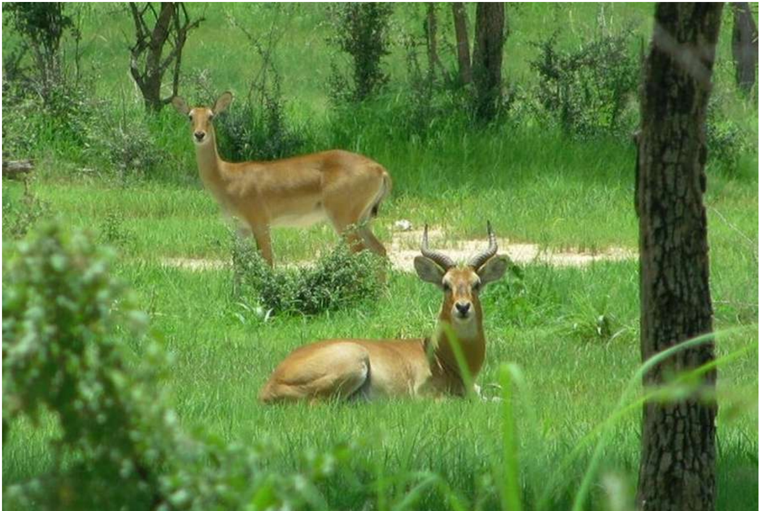
Couple de Cob de Buffon, Parc National du W, Niger © Hamissou Halilou Malam Garba. s.d.

Elle aura lieu le 26 Décembre 2022 à partir de 15h GMT+1. Pour rejoindre, https://tinyurl.com/4sebnew7 .