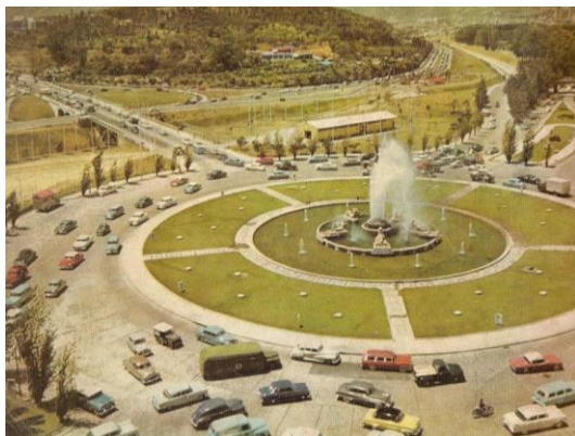
Plaza Venezuela y Los Caobos en 1940 ca. y 1950 ca.

Hacia lo que comenzaba a perfilarse como el umbral del este caraqueño, otra obra emblemática conmemorativa fue la creación de la Plaza Venezuela en el nodo donde convergen las avenidas Lincoln, La Salle y Lima, cuyo origen se remonta a 1940 cuando se crea la Urbanización Los Caobos. La plaza serviría de nodo de articulación de la avenida La Salle, principal eje de la urbanización con la avenida Monumental del Este, mediante la creación de una rotonda ornamentada mediante una fuente en cuyo centro destacaba una escultura figurativa con la imagen de unos venados, la cual duraría hasta 1945 cuando en el gobierno de Medina Angarita se remueve para ampliar la rotonda e insertar una gran fuente circular con un chorro de agua vertical central. En 1948 se decidió reformar nuevamente la plaza instalando una fuente luminosa de planta circular, en cuyo borde se dispusieron estatuas alegóricas conmemorativas a los "titanes de Venezuela": El Ávila, el Ande, la Orinoquia, la Llanura y el Caribe, cuya concepción y ejecución estuvo a cargo del escultor Ernesto Maragall, concluyéndose en 1953. La obra fue removida en 1963 y trasladada al Parque Los Caobos, dando origen a un singular proceso de sucesivas reformas de la plaza que llega hasta nuestros días.