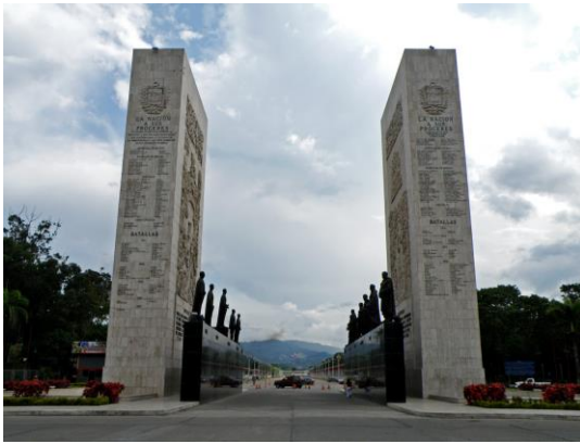
Monumento a los Próceres