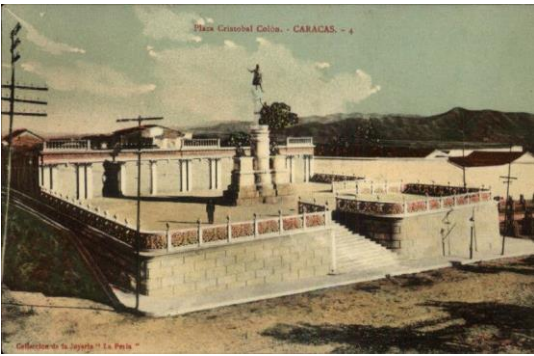
Plaza Boulevard Macuro y Monumento a Cristóbal Colón. (1910 ca.).

anteriormente ocupaba la Casa de Misericordia y la Plaza/Bulevar Macuro (1893) en conmemoración del primer centenario de la llegada de Cristóbal Colón a costas venezolanas en Puerto Macuro. El primero consistió en una plaza de planta cuadrangular surcada por ocho caminerías, que demarcan sus ejes y diagonales y convergían en un espacio circular central. Fue ordenado en el segundo gobierno de Guzmán Blanco para honrar a los próceres y la batalla que selló la libertad de Venezuela. El segundo consistió en una plataforma rectangular rodeada por una balaustrada de reminiscencias neoclásicas en cuyo centro se erigió el grupo escultórico de Cristóbal Colón diseñado por Rafael de La Cova. Se presentaba elevada sobre el nivel de la calle, entre las esquinas de López y de Romualda, lugar que en la actualidad corresponde a la intersección de las avenidas Urdaneta y Fuerzas Armadas. Fue encomendado en el segundo gobierno de Joaquín Crespo.