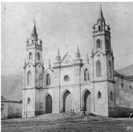
Panteón Nacional 1900 ca.

Durante el siglo XIX, como consecuencia directa de la Ilustración del siglo precedente ha de producirse una transferencia de los focos conmemorativos del tema religioso al contenido laico, y con ello los bienes edificados se orientan a nuevos tópicos que habrían de sustituir a las figuras privilegiadas de la Colonia, personificadas en representantes simbólicos de la Monarquía y la Iglesia, por la de los héroes de la Independencia y más tarde a los de la Federación, teniendo en el Libertador Simón Bolívar a su máximo objetivo como figura laudable de conmemoración. El inicio del Culto a Bolívar y demás héroes patrios comienza en el periodo de Guzmán Blanco, asumiendo un modelo conmemorativo foráneo al seguir la pauta efectuada en Francia cuando la Iglesia de Santa Genoveva promovida como Catedral de París cede su uso primigenio para albergar los restos de los hombres ilustres de la República francesa. En consecuencia, en Caracas se decide convertir la Iglesia de la Trinidad, que se encontraba en proceso de reconstrucción en estilo neogótico según proyecto del Ingeniero José Gregorio Solano (Zawisza, 1989), en un Panteón Nacional para albergar los restos del Libertador, a los que más tarde se sumarían los demás héroes de la Independencia.