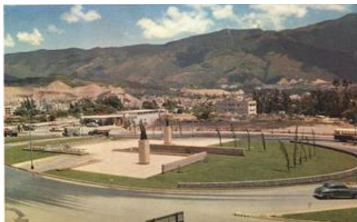
Plaza de la Bandera y Monumentos de Atanasio Girardot, Camilo Torres y Antonio Ricaurte. 1955 ca.

Formarían parte de estos espacios la Plaza Urdaneta (1954), cercana al centro de la capital, anexada a la Plaza de la colonial parroquia de La Candelaria, en el marco del ensanche de la Avenida Este-Oeste 1 para dar paso a la Avenida Urdaneta, en la cual se incorporó la estatua ecuestre del General Rafael Urdaneta que había sido contratada en 1949 a Francisco Narváez para la actual Plaza O'leary de la Urbanización El Silencio, originalmente nombrada como Plaza Urdaneta. (Pacanins, 1965).