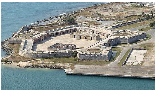
Castillo San Felipe de Puerto Cabello.

Durante el periodo colonial los diversos centros poblados concentraban lo conmemorativo en las fiestas patronales dedicadas a los santos patronos a quienes se ofrecieron las fundaciones de los pueblos y ciudades, si estas fructificaban, en busca de protección hacia los ataques de resistencia de las etnias aborígenes y a las plagas de insectos como las langostas y los mosquitos que atacaban a los pobladores. Los nombres de santos como San Sebastián, San Mauricio, Santiago de Compostela, San José, San Juan Bautista, o de los arcángeles San Gabriel, San Miguel y San Rafael encabezan el nombre de muchas fundaciones en cuyo honor no solo se levantaron los centros poblados, sino también ermitas, capillas e iglesias que en la actualidad enriquecen nuestro patrimonio cultural edificado, a lo largo de toda la geografía.