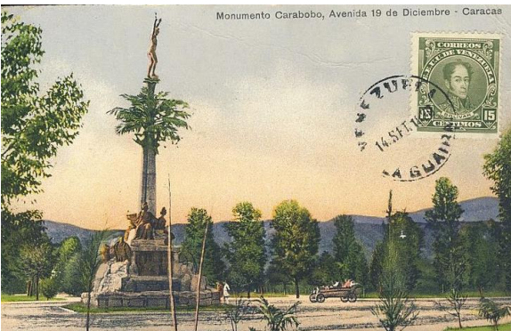
Monumento a Carabobo (La India del Paraíso) 1911 ca.