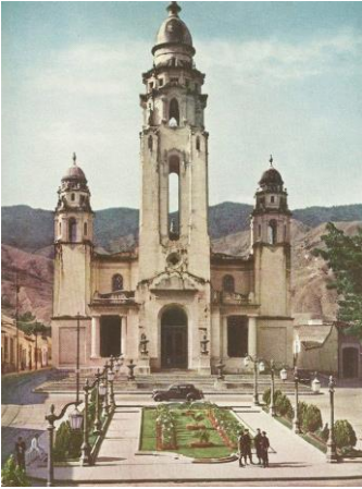
Panteón Nacional 1930 ca.