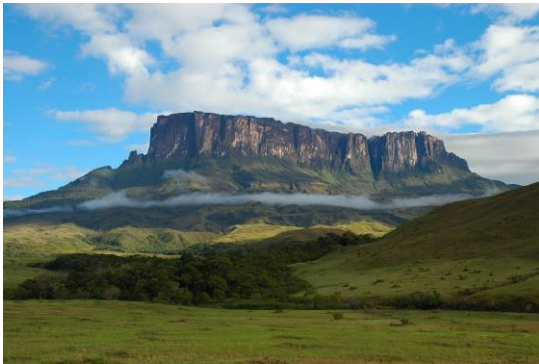
Monte Roraima.

El territorio que ocupa Venezuela, fue en la época prehispánica el hábitat natural de numerosas etnias dentro de las cuales destacan las de filiación Caribe y las de filiación Arawac. Estos grupos tenían entre sus creencias politeístas la adoración a determinados accidentes geográficos tales como montañas, ríos y lagunas como deidades a las que rendían diversos cultos a través del año. El Auyantepui o Auyantepui , formación del Macizo Guyanés donde se ubica el Salto Ángel, la caída de agua más alta del mundo en la lengua de los pemones significa la “ montaña del diablo ”, y el Monte Roraima , otra formación ubicada en la frontera con Brasil, era referido por los pemones como “ la madre de todas las aguas ”, en alusión a que en