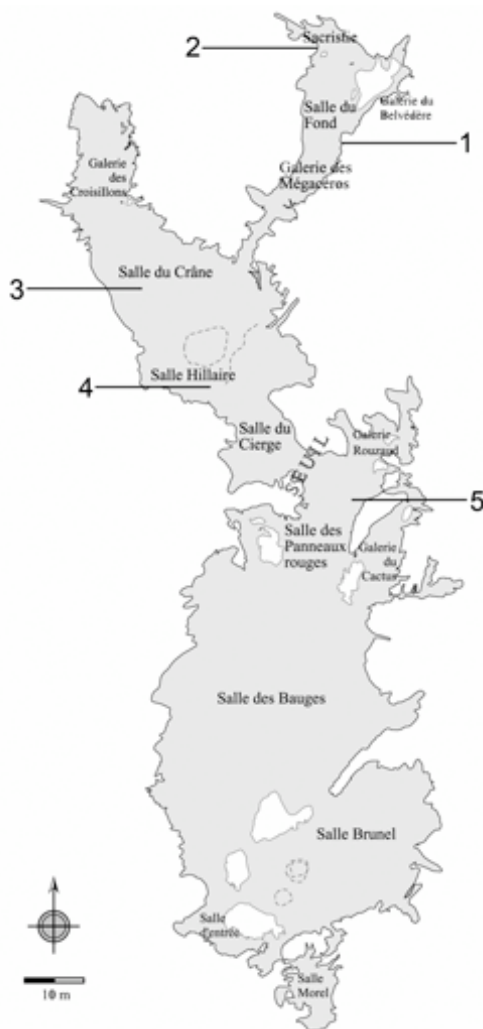
Fig. 1. Localisation des signes de type Chauvet dans la grotte. 1. Paroi droite de la salle du Fond ; 2. Le mammouth de la Sacristie ; 3. Le pendant du Renne dans la salle du Crâne ; 4. Les retombées de voûte de la salle Hillaire ; 5. Le panneau des Mains positives. Topographie Y. Le Guillou et F. Maksud.

Un renforcement de la paroi renferme un groupe de cinq de ces signes à deux lobes. Vus de loin, ils paraissent constituer un ensemble, malgré leur disposition sur quatre plans de paroi (fig. 3).