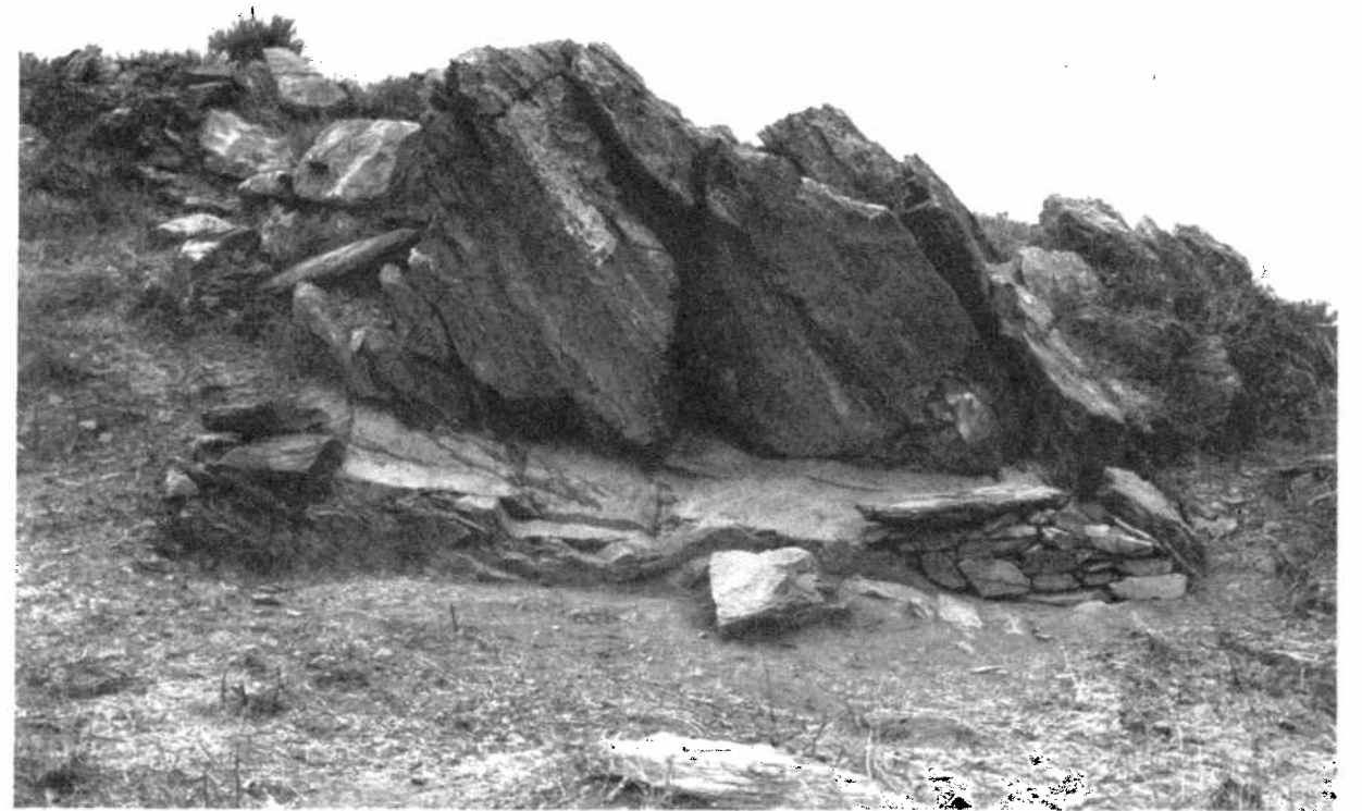
▲ Figure 1. Rocher de Fornols-Haut, Campome, Pyrénées-Orientales, France.

* SACCHI D. avec la collaboration de J. ABELANET, J.L. BRULE, Y. MASSIAC, Cl. RUBIELLA et Ph. VILETTE, 1988 - Les gravures rupestres de Fornols-Haut, Pyrénées-Orientales, L'Anthropologie (Paris), t. 92, n° 1 : 87-100, 19 fig.