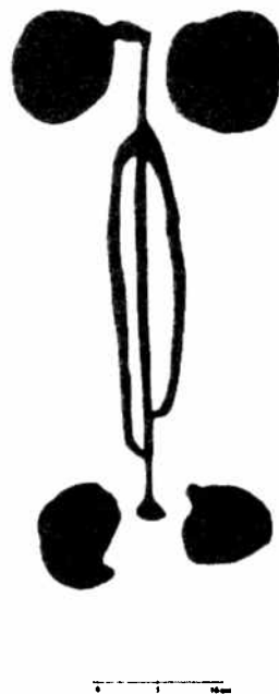
Fig. 6 - Relevé de peintures dans la Grotte Sögütdere.

En bordure d'une petite vallée latérale du Sögütdere, l'on trouve deux ensembles peints, l'un sur la surface d'un petit abri, l'autre sur la paroi d'une grotte. Le premier présente une grande et une petite représentation humaine, sans bras, dessinées dans un style schématique ; à leur côté, un signe en forme de 8 présente un point à l'intérieur des cercles (fig. 5). Les peintures de la grotte sont toutes massivement détruites. L'on ne peut identifier qu'un seul signe étrange de 50 cm de haut. Au premier coup d'œil, il ressemble à un chariot à quatre roues, vu de dessus, motif très fréquent dans l'art rupestre (fig. 6). Mais la partie centrale de forme ovale n'a rien à voir avec un chariot. Ce signe doit donc avoir une autre signification.