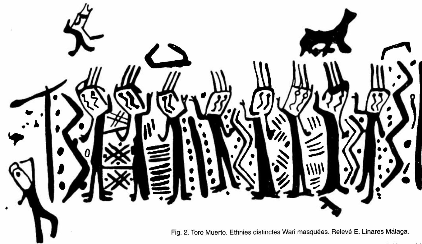
Fig. 2. Toro Muerto. Ethnies distinctes Wari masquées. Relevé E. Linares Málaga.

Unfortunately, this extraordinary rock art site is in great danger of being completely destroyed. A new settlement near the site, Candelaria, has begun irrigation of part of the zone. Moreover, an agreement exists between the Instituto Nacional de Cultura (INC) and the settlers that allows this activity. Besides, many engraved rocks have been affected by the extraction of stones for construction work or by vandalism.