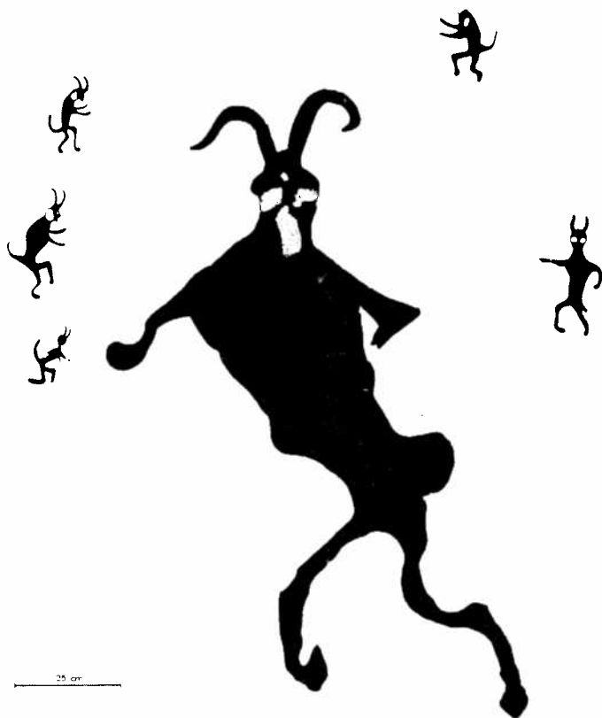
Habererkirche near Reutern (Niederbayern) Peinture noire avec des reprises rouges et vertes. Figure principale : H : environ 1,50 m (Züchner 1976). Black painting with red and green additions. Main figure : H=ca. 1,50 m. (Züchner 1976).

gen (Bade-Württemberg) (Hahn 1990, 1992), la tombe mégalithique de Warvurg (Kr. Höxten, Westphalie), ornée de symboles bien connus dans l'art mégalithique et rupestre d'Europe occidentale (Günther 1990), et l'énorme menhir de Weilheim près de Tübingen (Bade-Württemberg), orné de 5 hallebardes et d'un bouclier rond (Reim 1985, 1992). J'ai publié une peinture rouge, découverte par un amateur près de Freyung (SE-Bavière). Le panneau de 3,50 m de long représente un village avec des maisons à colombage, une église, un château, un marché, et il est entouré d'un grand mur (Züchner 1992, 1993). Style et localisation, en altitude dans des montagnes boisées loin des villages, rappellent de nombreux sites d'art rupestre préhistoriques. Mais ce panneau appartient à un ensemble de peintures et gravures sub-contemporaines centrées en Bavière du Sud et dans les Alpes autrichiennes et bavaïroises (Adler 1991, Züchner 1976). On doit la connaissance de cet important témoignage du folklore à des amateurs passionnés. On peut s'attendre à ce que les futures publications de ces sites et des superbes grottes de France et d'Espagne suscitent l'intérêt général pour l'art rupestre. Peut-être alors le nombre de sites augmentera-t-il en Allemagne.